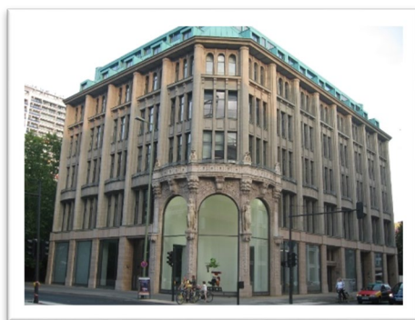
DIE FAMILIENUNTERNEHMER e.V. Charlottenstraße 24 10117 Berlin

Hinweis! Bitte fahren Sie nicht in die Charlottenstraße 24 in Berlin-Spandau, sondern kommen Sie in die Charlottenstraße 24 in Stadtmitte!